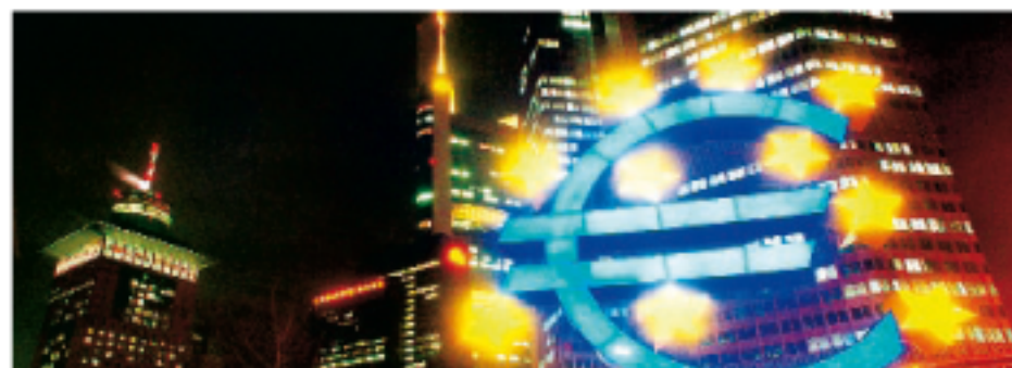
Europäische Zentralbank in Frankfurt: Zinsschritt wohl im März